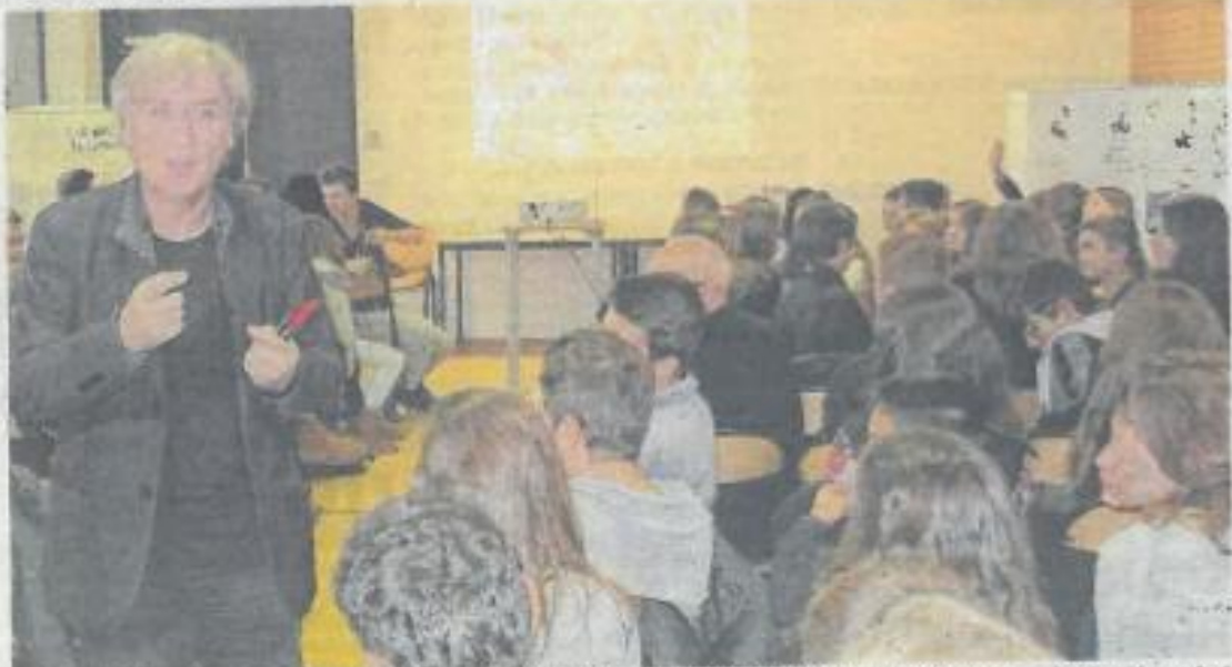
Essonne, hier après-midi. « On peut tout dire du moment qu'on argumente son avis. Moi, je le fais avec mes dessins. Vous, c'est ce que vous devez faire dans vos copies. Votre dessin, je l'ai montré à la télévision... C'est touchant de savoir qu'il vous a permis de rebondir sur un tel drame », explique Plantu à son auditoire captivé.